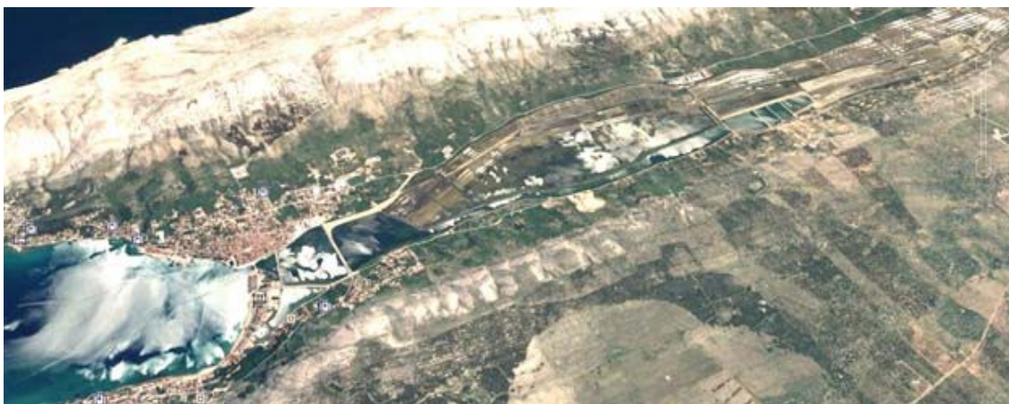
Illustration 3. Ecosystème salinier solaire de Pag en Croatie