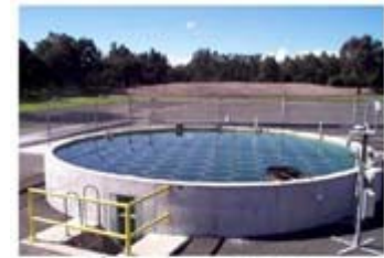
A 50 m 2 solar pond at RMIT University