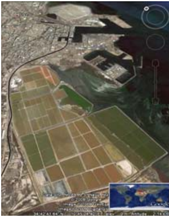
Illustration 2. Sfax-Thyna en Tunisie : Un exemple méditerranéen de complémentarité potentielle « marais salants et bassins solaire/ville-port-territoire », (Source GIS Amphibia).

Sur ces bases un partenariat euro-méditerranéen important a été mis en place avec la Région autonome de Sardaigne qui se propose comme chef de file associé à MALTAE initiateur et Chef de projet pour apporter des réponses à cette problématique dans le cadre de l'appel à propositions du programme européen IEV CBC MED 2014-2020 lancé à l'Eté 2017, et pour lequel, entre autres pays éligibles ou associés comme la Croatie), la Tunisie, l'Egypte, la Grèce, l'Espagne, ...devraient être largement parties prenantes, pour une durée de 3 ans, au côté de l'Italie et de la France, pour mener ce projet (Acronyme RESILIENT).